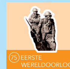
75 EERSTE WERELDOORLOG