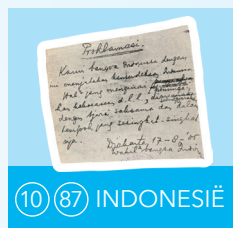
10 87 INDONESIË