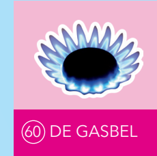
60 DE GASBEL