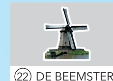
22 DE BEEMSTER