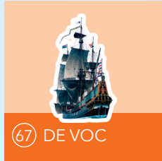
67 DE VOC