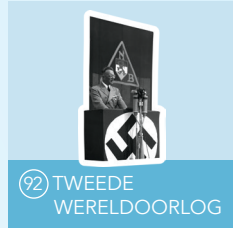
92 TWEDE WERELDOORLOG

De Canon toont een overzicht van de Nederlandse geschiedenis en opent in september 2017. Nu al zijn onderwerpen uit deze tentoonstelling te zien in ons museumpark.