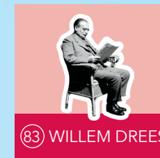
83 WILLEM DREES