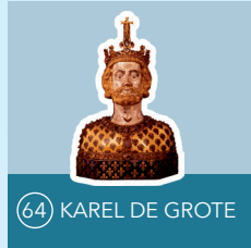
64 KAREL DE GROTE