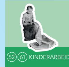
52 61 KINDERARBEID