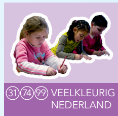
31 74 99 VEELKLEURIG NEDERLAND